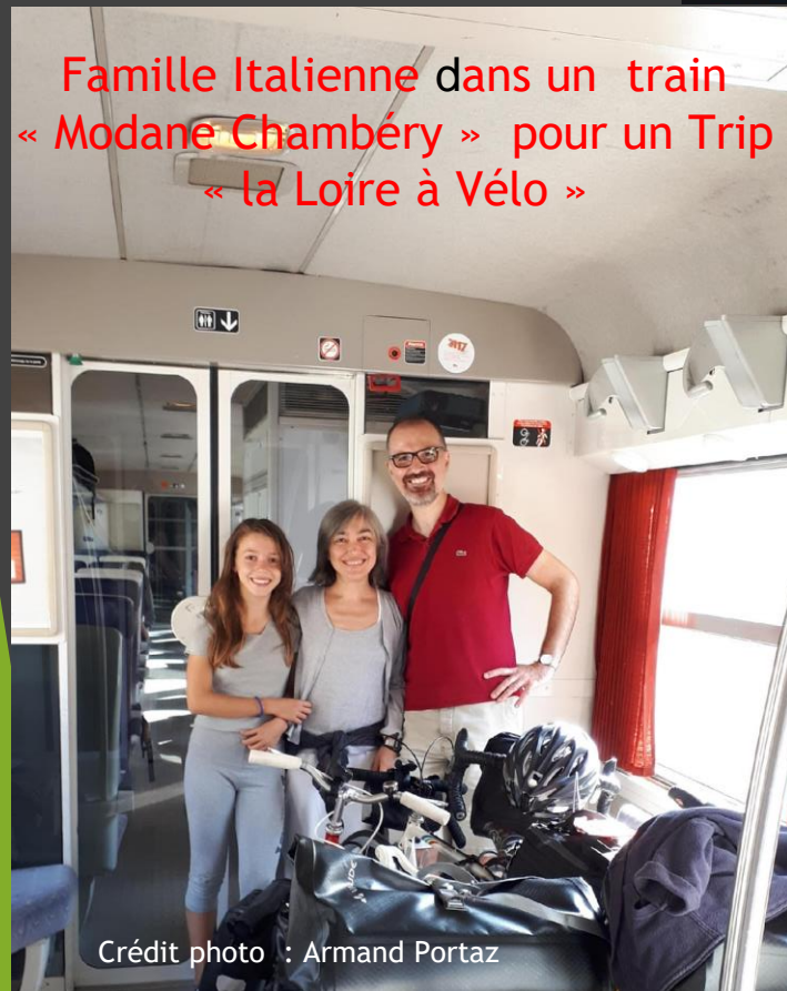
Famille Italienne dans un train « Modane Chambéry » pour un Trip « la Loire à Vélo »